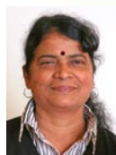
Subramaniam Mangayarkarasi Raumpflegerin