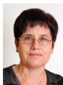
Tenore Filomena Raumpflegerin